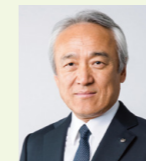
「公益社団法人日本獣医師会会長」および「世界獣医師会 (WVA) 会長 (2026-2027年)」